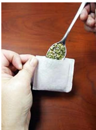
Рисунок 9. Внешний вид пакетика для чая