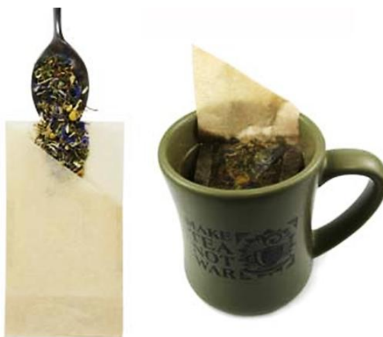
Рисунок 7. Внешний вид одноразового фильтра для чая