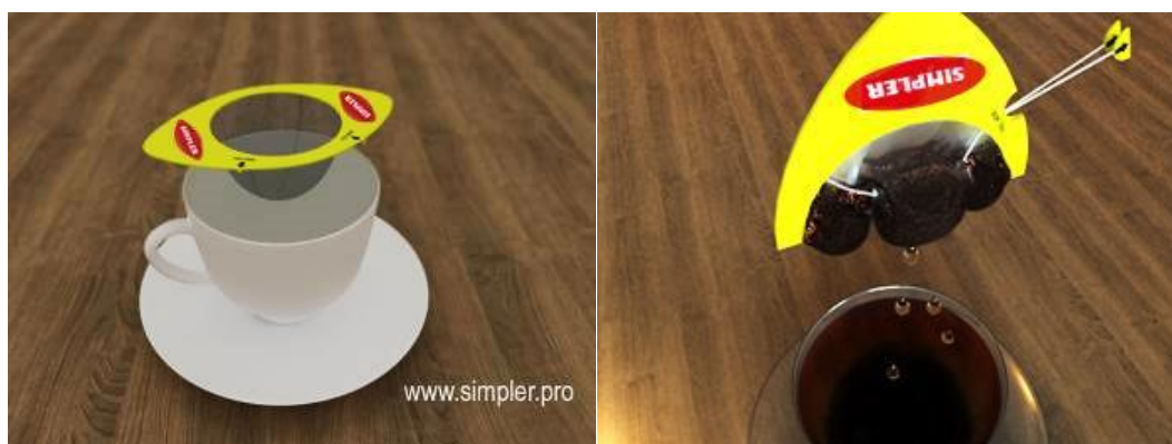
Рисунок 13. Внешний вид одноразового чайного ситечка предлагаемого в рамках проекта

Устройство представляет собой складное сито с отжимным механизмом. Сито состоит из основы (жесткого контура), кладущейся на край сосуда с водой, и влагопроницаемой заварочной емкости, которая погружается в воду. Основа сита имеет линию сгиба, по которой основа сита складывается по окончании заваривания. По поверхности влагопроницаемой заварочной емкости проложены нити, составляющие отжимной механизм, которые вытягиваются, отжимая заварку.