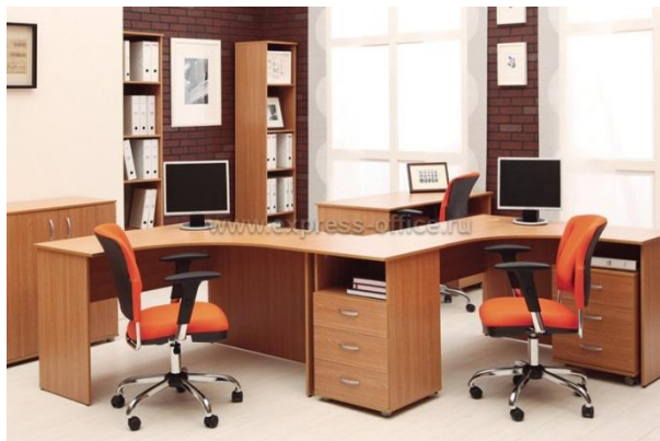
Рисунок 17. Мебель для персонала Версия (Россия).

Набор мебели состоит из стойки для приемной, набора мебели для персонала и директора. Внешний вид мебели представлен на следующих изображениях.