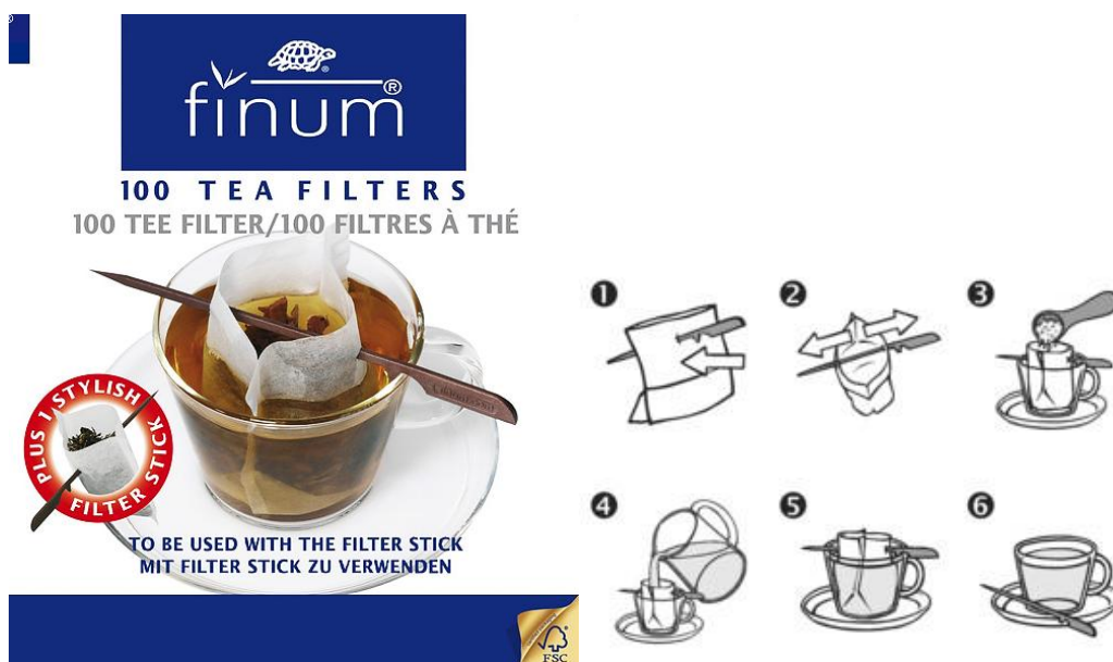
Рисунок 12. Внешний вид одноразового чайного фильтра с палочкой держателем

Предлагаемое в рамках проекта сито имеет принципиальные отличия, совокупность которых существенно улучшает его потребительские свойства и обеспечивает максимум удобства его использования, при минимуме потерь качества завариваемого чая.