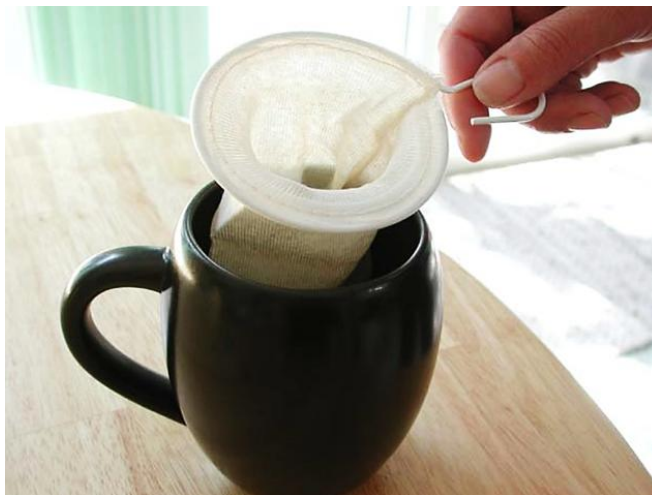
Рисунок 8. Внешний вид хлопковой сеточки для чая