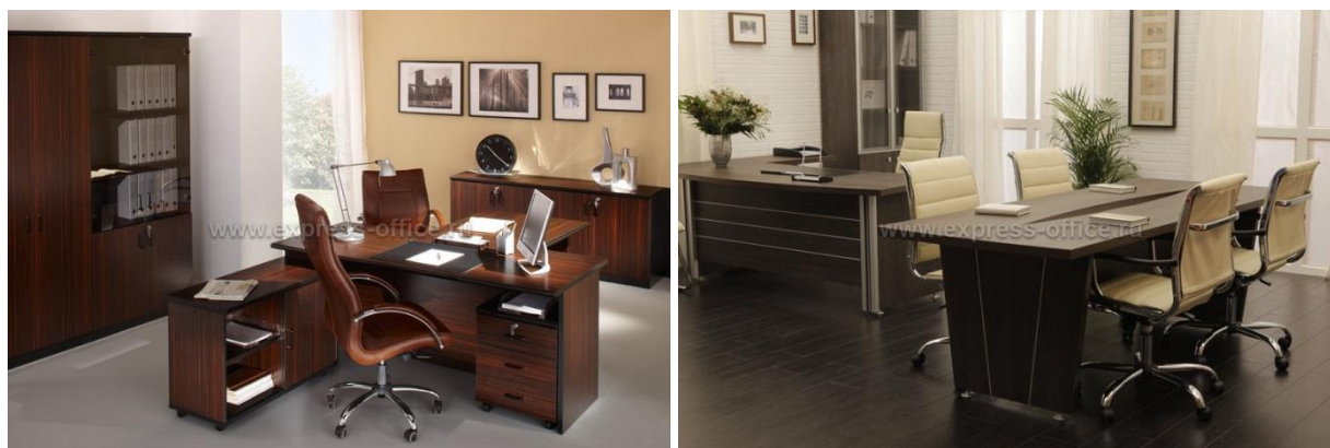
Рисунок 18. Мебель директора Delta System (Италия), стол для переговоров Vasanta (Россия)

Инициатор проекта так же предусматривает расходы на разработку технологического процесса производства одноразовых сит и разработку оборудования. Стоимость разработки оборудования принимается на уровне ** *** руб. Это определено по аналогии с подобными проектами, так как на сегодняшний день предложениями по производству таких работ и исследований Инициатор не располагает.