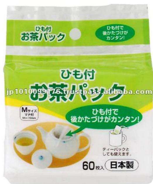
Рисунок 10. Внешний вид пакетика для чая