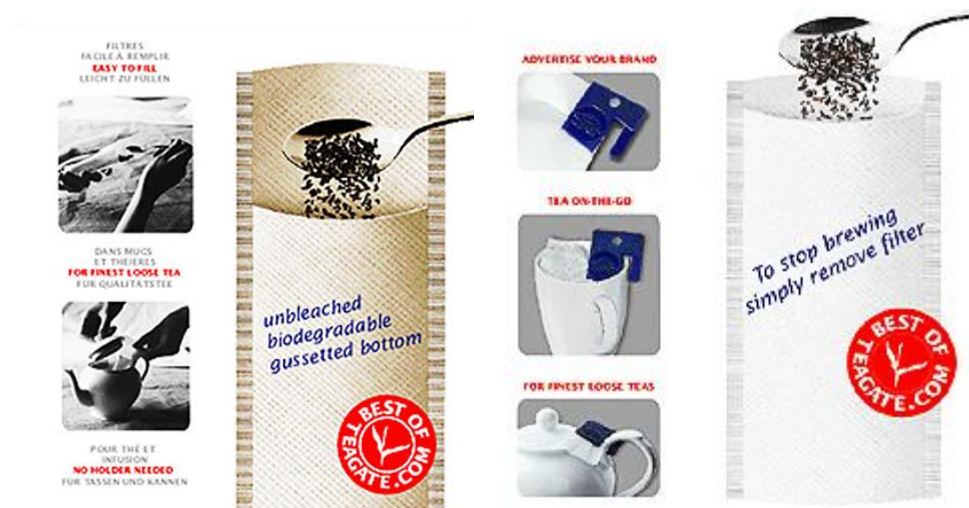
Рисунок 11. Внешний вид одноразового чайного фильтра