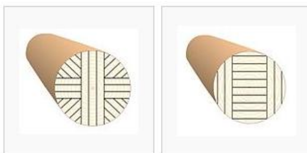
Схема радиальной распиловки круглых лесоматериалов